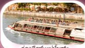
คลองเรือชมแม่น้ำแซน