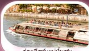
คลองเรือชมแม่น้ำแซน