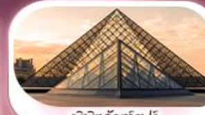
พิพิธภัณฑ์ลูฟร์