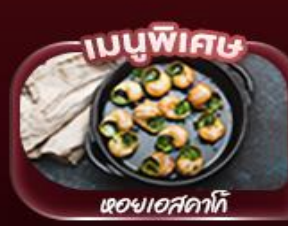
เมนูพิกนิก