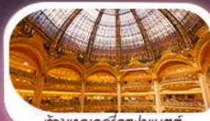
ห้างแกรนด์โกลาฟอาแมตตี

Emirates บินทุกวัน น้ำหนักกระเป๋า 30 KG.