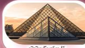
พิพิธภัณฑ์ลูฟวร์