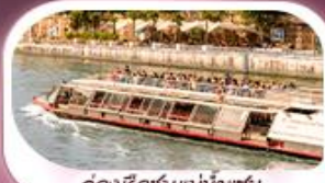
คลองเรือชมแม่น้ำแซน