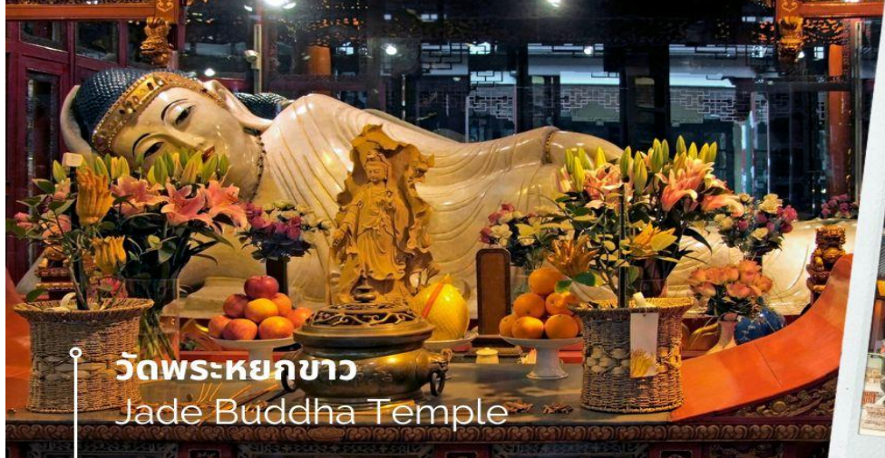
วัดพระหยกขาว Jade Buddha Temple

เช้า 10) รับประทานอาหารเช้า ณ ห้องอาหารโรงแรม (12) นำท่านชม วัดพระหยกขาว เป็นวัดที่มีชื่อเสียงมากที่สุดในเมืองเชียงใหม่ ซึ่งเป็นที่รู้จักจากพระพุทธรูปสององค์ที่สร้างขึ้นจากหยกทั้งแท่ง องค์พระพุทธรูปปางหนึ่งมีความสูง 190 เซนติเมตร และ หุ้มด้วยเพชรพลอย หิน มโนรา และ มรกต และองค์พระพุทธรูปปางไสยาสน์ มีความยาว 96 เซนติเมตร นอนเอียงด้านขวาและหนุนพระเศียรด้วยพระหัตถ์ขวา ถือเป็นวัดที่มีทั้งชาวจีนและนักท่องเที่ยวเดินทางมาสักการบูชาตลอดทั้งวันจากนั้น