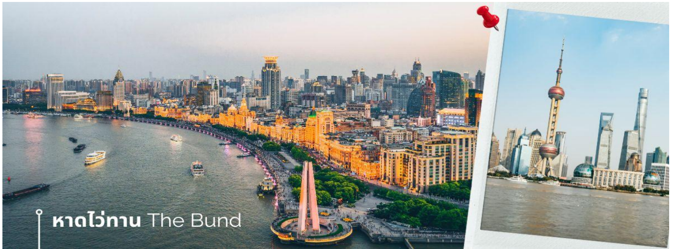
หาดไวگان The Bund

CTGPVG2 เชียงใต้ คุ้มหวาน ช่างเหรา หุบเขาเทวดา 5วัน 4คืน ไทยแอร์เวย์ (TG) (Feb-May25)