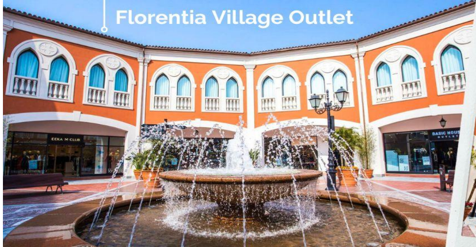
Florentia Village Outlet

เที่ยง 10) รับประทานอาหารกลางวันที่ภัตตาคาร (13) เมนูพิเศษ..เสี่ยวหลงเปา นำท่านอิสระช้อปปิ้ง Florentia Village Outlet ห้างเอาท์เล็ตขนาดใหญ่ที่รวบรวมแบรนด์ชั้นนำต่างๆมากมายให้ท่านเลือกซื้อช้อปปิ้งไม่ว่าจะแบรนด์ BALENCIAGA, GUCCI, BALENCIAGA, GUCCI, GUESS, PRADA, SAINT LAURENT PARIS, BURBERRY, ADIDAS, CONVERSE และอีกมากมายให้ท่านช้อปปิ้งเป็นของฝากแก่ญาติสนิท มิตรสหาย และที่นี่เป็นมากกว่าการช้อปปิ้ง เพราะที่นี่มีเมืองจำลองในอิตาลีที่มีล้าคลองและเรือคอนโตลาและสถาปัตยกรรมยุโรปคลาสสิกจำลองสามารถถ่ายรูปเช็คอินสไตล์ยุโรปได้อีกด้วย