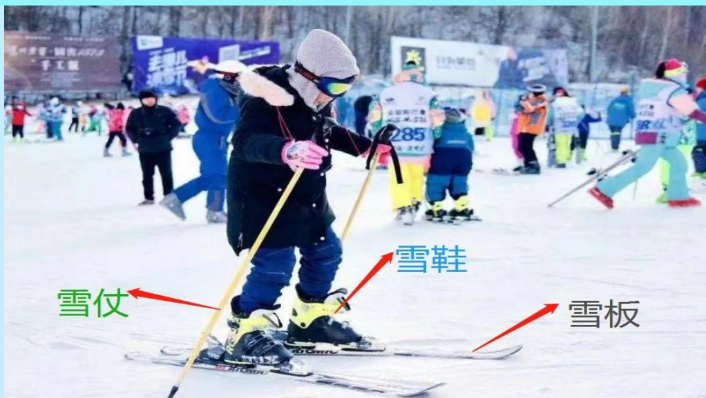
VHRB75XJ-27-2 ฮาร์บิน ฟ่ำใส ใส 7 วัน 5 คืน BY XJ

Optional : อุปกรณ์การเล่นสกี (รองเท้า+กระดานสกี+ไม้ค้ำ) (ค่าเช่าอุปกรณ์สกีท่านละ 260 หยวน สามารถใช้ได้ 3 ชั่วโมง สำหรับท่านที่สนใจ สามารถแจ้งความประสงค์ และสอบถามราคากับทางหัวหน้าทัวร์อีกครั้ง)