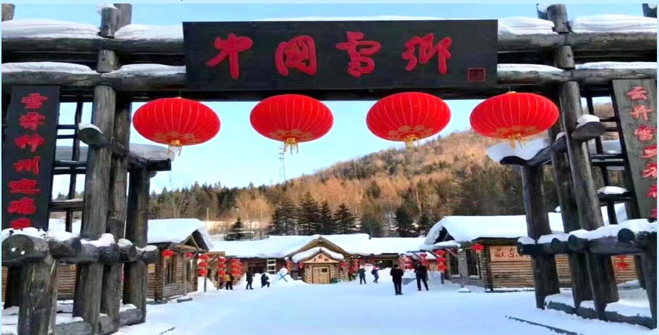
VHRB75XJ-27-2 ฮาร์บิน ฟ่ำไส ไส 7 วัน 5 คืน BY XJ

(หมายเหตุ : ปริมาณของหิมะ และความหนาแน่นของหิมะนั้น ขึ้นอยู่กับสภาพอากาศในแต่ละปี หากสภาพอากาศไม่เอื้ออำนวยส่งผลให้หิมะละลาย ทางบริษัทขอสงวนสิทธิ์ ไม่คืนค่าใช้จ่ายทุกกรณี เนื่องจากอยู่นอกเหนือความควบคุมของบริษัท)