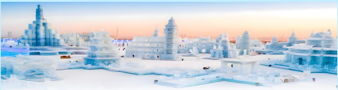
VHRB75XJ-27-2 ฮาร์บิน ฟ้าใส ใส 7 วัน 5 คืน BY XJ