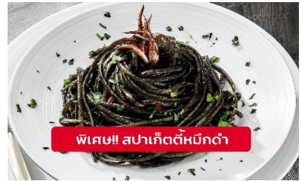
พิเศษ!! สปาเก็ตตี้หมึกดำ

Highlight! เมื่อเยือนเกาะเวนิส เมนูที่ขึ้นชื่อและหากได้มาต้อง ได้ลิ้มลอง สปาเก็ตตี้ผัดซอสหมึกดำที่คลุกเคล้ากับความหอม นุ่มนัวกับบรรยากาศ