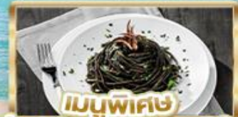
เมนูพิเศษ