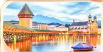
สะพานไมซ์าเปล