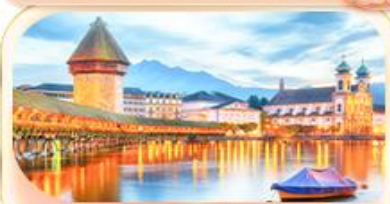
สะพานไมซ์าเปล