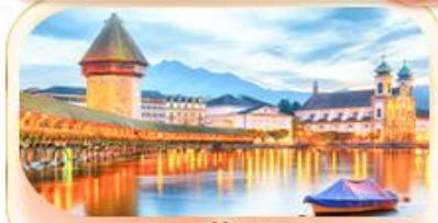
สะพานไมซ์าเปล