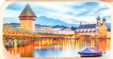
สะพานไมซ์าเปล