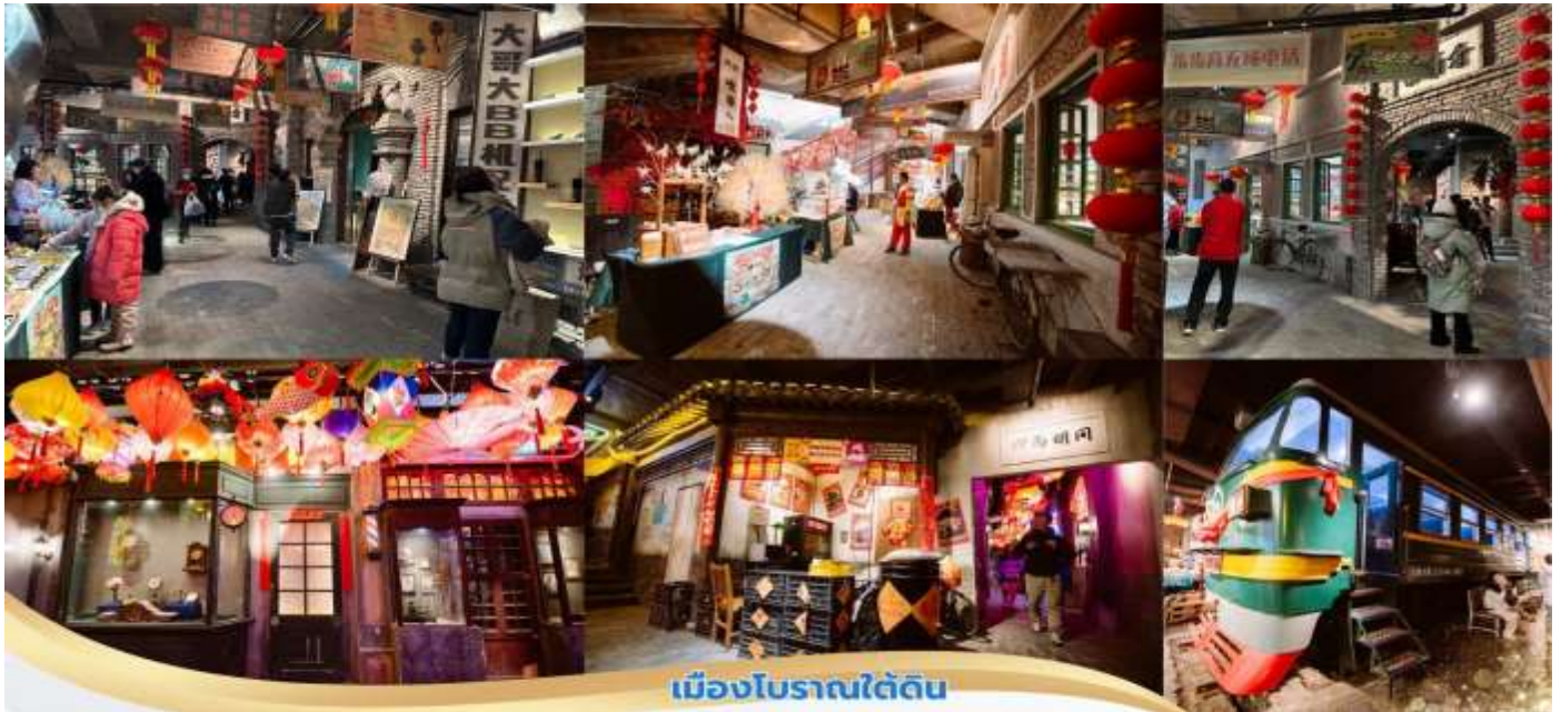
เมืองโบราณใต้ดิน

นำท่านชม เมืองโบราณใต้ดิน อยู่ในห้างหวังฝูจิ่ง เป็นการจำลองกรุงปักกิ่งในช่วงของทศวรรษที่ 1980 และ 1990 ภายในเมืองโบราณจะมีสถานีรถไฟเก่า หัวยุทธจักรดีเซล Dongfeng เป็นหนึ่งในหัวยุทธจักรดีเซล ที่ใช้กับการรถไฟของจีน และเป็นรุ่นตัวแทนของหัวยุทธจักรดีเซลขับเคลื่อนด้วยไฟฟ้ารุ่นแรกในจีน เป็นจุดเช็คอินใหม่ให้ท่านได้เลือกถ่ายรูป