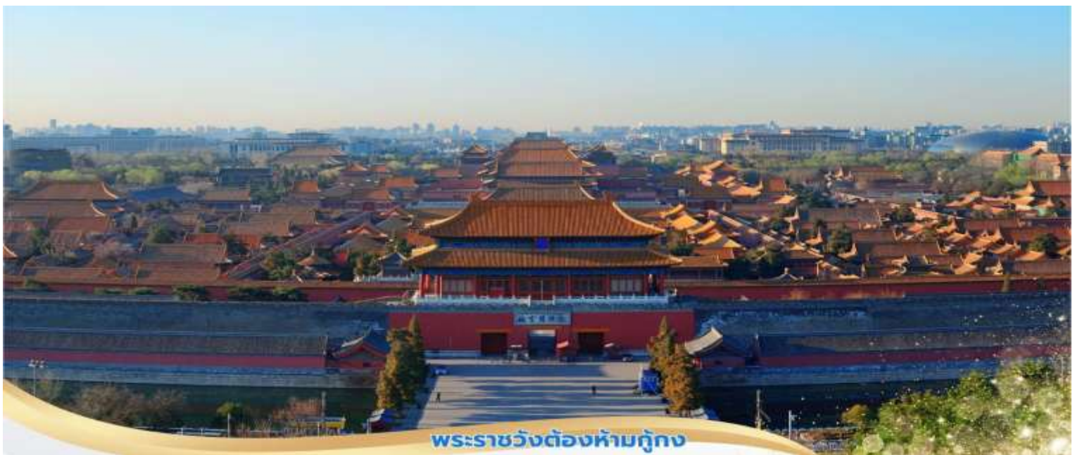
พระราชวังต้องห้ามกุ๊กก

จากนั้นนำท่านเดินเข้าสู่ พระราชวังกุ๊กก สร้างขึ้นในสมัยจักรพรรดิหย่งเล่อแห่งราชวงศ์หมิง เป็นทั้งบ้านและชีวิตของจักรพรรดิในราชวงศ์หมิงและชิงรวมทั้งสิ้น 24 พระองค์ พระราชวังเก่าแก่ที่มีประวัติศาสตร์ยาวนานกว่า 500 ปี มีชื่อในภาษาจีนว่า ‘กุ๊กก’ หมายถึงพระราชวังเดิม มีชื่อเรียกอีกอย่างหนึ่งว่า ‘ชื่อจีนเจิง’ ซึ่งแปลว่า ‘พระราชวังต้องห้าม’ เหตุที่เรียกพระราชวังต้องห้าม เนื่องมาจากชาวจีนถือคติในการสร้างวังว่า จักรพรรดิ