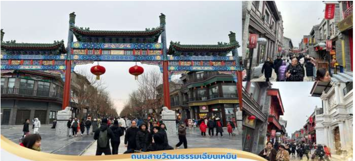
ถนนสายวัฒนธรรมเจียนเหมิน

บ่าย จากนั้นเดินทางไปยังถนนคนเดินสายวัฒนธรรม เจียนเหมิน ถนนเจียนเหมินย่านการค้าแหล่งใหญ่ด้านหน้า มีซุ้มประตูไม้ห้าช่องขนาดใหญ่ มีประวัติมายาวนานกว่า 600 ปี สมัยราชวงศ์ซิง ถนนการค้านี้เป็นถนนเส้นตรงสองข้างทางเป็นอาคารทรงโบราณสองชั้น ผังเป็นสี่เหลี่ยมตามลักษณะสถาปัตยกรรมโบราณ ตกแต่งด้วยกระเบื้องสีเขียวและสีแดง อาคารโบราณเกือบทั้งหมดถูกดัดแปลงเป็นร้านค้า เช่น ร้านกาแฟ ร้านขายของฝาก ร้านขายสินค้านำเข้า ร้านถ่ายรูปโบราณ ร้านขายสินค้าหัตถกรรม ร้านขายเสื้อผ้า และร้านขายอาหาร