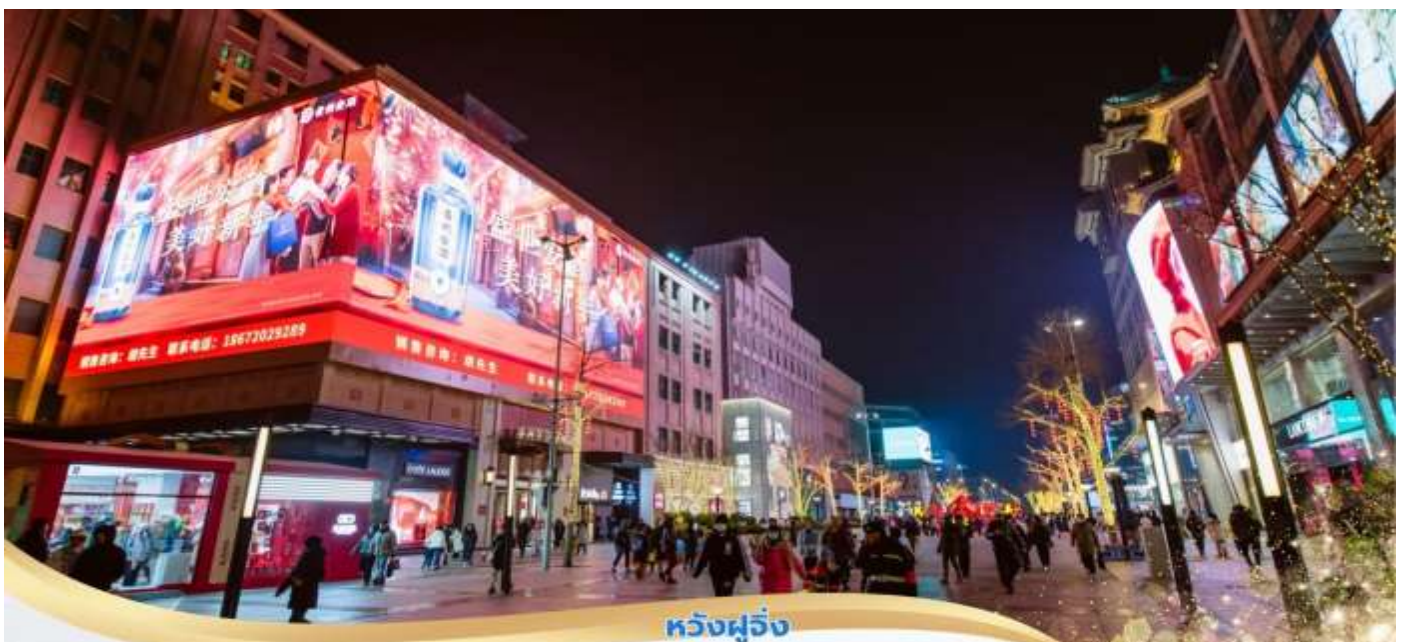
หวังฝูจิ่ง

จากนั้นนำท่านเดินทางสู่ ถนนหวังฝูจิ่ง ถนนช้อปปิ้งที่เก่าแก่ที่สุดและมีชื่อเสียงที่สุดในกรุงปักกิ่ง เป็นจุดท่องเที่ยวที่พลาดไม่ได้เมื่อมาเยือนเมืองปักกิ่ง มีสินค้าให้เลือกชม เลือกช้อป อาทิเช่น เสื้อผ้า ของใช้รวม