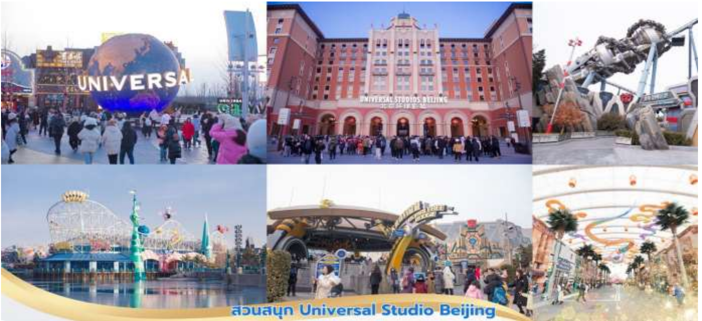
สวนสนุก Universal Studio Beijing