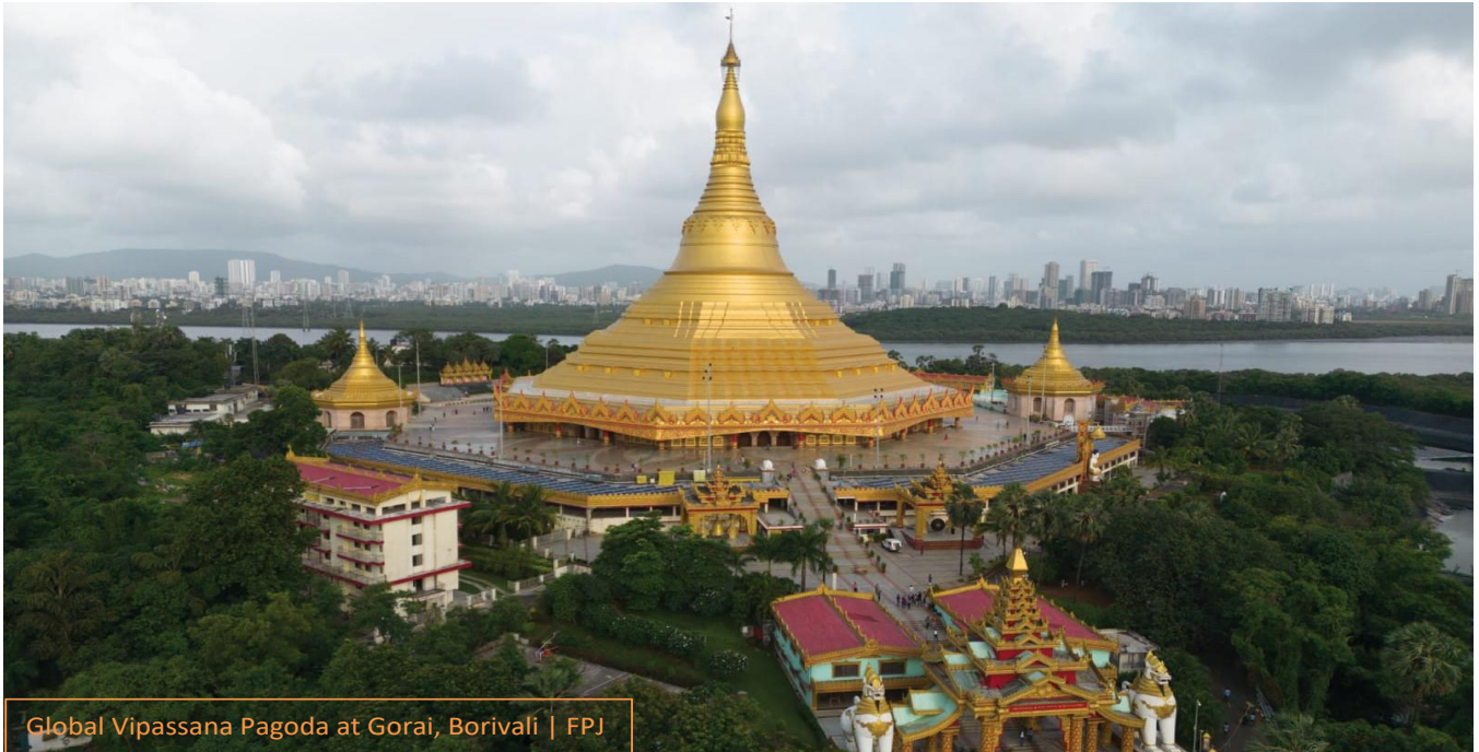
Global Vipassana Pagoda at Gorai, Borivali