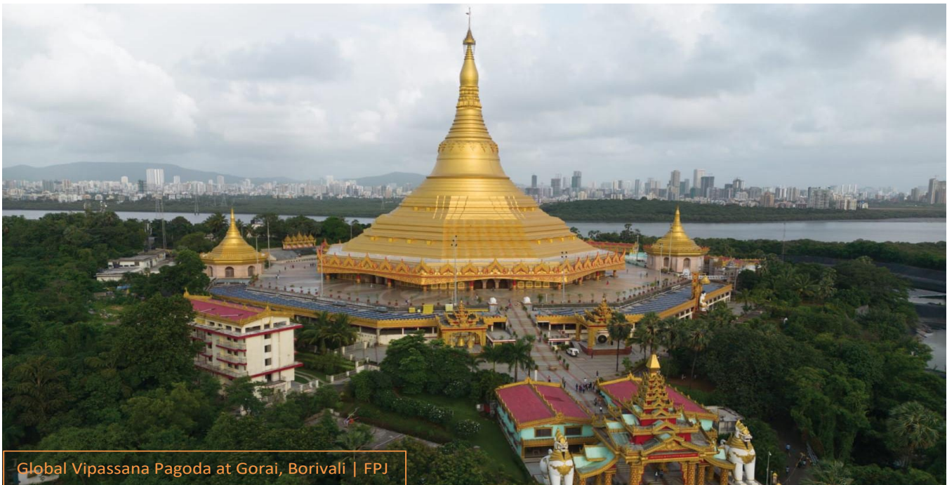
Global Vipassana Pagoda at Gorai, Borivali

(กรณางดใส่ กางเกงขาสั้น ) นำท่านชม วิหารท่านโกเอ็นก้า สร้างขึ้นเมื่อปี พ.ศ.2517 ตามพลังศรัทธาชาวฮินดู ผู้เลื่อมใสในพระพุทธศาสนา สถาบันวิปัสสนานานาชาติ Global Vipassana Pagoda "ธรรมคิริ" ที่เมืองอิกัตปุรี ใกล้ๆ กับเมืองบอมเบย์ เจดีย์นี้เปิดอย่างเป็นทางการโดยประติภา ปาฐील ประธานาธิบดีแห่งประเทศอินเดียในขณะนั้น เมื่อ 8 กุมภาพันธ์ 2009 ที่ดินที่สร้างนั้นเป็นที่ดินบริจาคอยู่บนแหลมระหว่างอ่าวเล็กโคโรทา ท่านโกเอ็นก้าเริ่มเดินทางไปเผยแผ่วิปัสสนาตามประเทศต่างๆ ทั่วโลก ท่านได้อำนวยการสอนวิปัสสนาหลักสูตร 10 วันในประเทศอินเดียและประเทศอื่นๆ รวมถึงมีสถานปฏิบัติธรรมมากมายที่ประเทศไทย ทั้งในซีกโลกตะวันตกและตะวันออกกว่า 400 หลักสูตร หลักการสอนของท่านโกเอ็นก้าได้รับการยอมรับโดยทั่วไป ทั้งในอินเดีย ประเทศที่ยังคงมีความแตกต่างทางด้านชนชั้นและศาสนาอย่างมาก และจากทั่วโลก ทั้งนี้เพราะคำสอนที่มีลักษณะเป็นสากล มิได้ขัดต่อหลักศาสนาใด ท่านเน้นเสมอว่ามนุษย์ทุกคน ไม่ว่าจะเชื่อชาติใด นับถือศาสนาใด และมีผิวสีอะไร ต่างก็มีความทุกข์ในรูปแบบเดียวกันทั้งสิ้น ในเมื่อความทุกข์ของมนุษย์เป็นสากล วิธีการปฏิบัติเพื่อให้พ้นจากความทุกข์จึงต้องเป็นสากลเช่นกัน