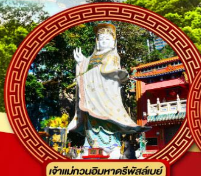
เจ้าแม่กวนอิมหาดริฟส์ลีย์