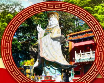
เจ้าแม่กวนอิมหาดริฟส์ลีย์