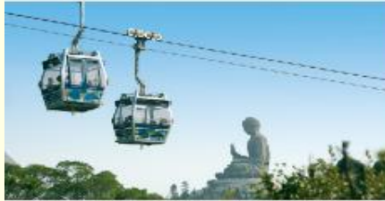
กระเช้าองปิง