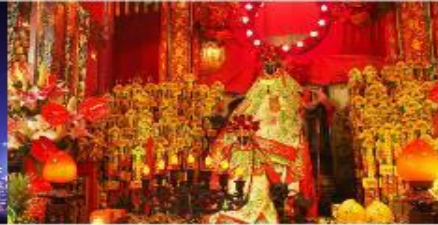
วัดเจ้าแม่กวนอิมสองฮา