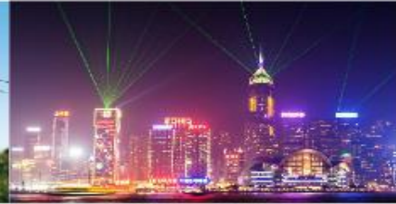
Symphony of Lights