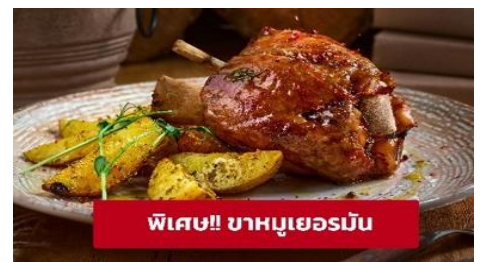
พิเศษ!! ขาหมูเยอรมัน

จากนั้นนำท่านเดินทางสู่ เมืองซาลซ์บูร์ก (Salzburg) ประเทศออสเตรีย (ระยะทาง 214 กม. / 3.15 ชม.) มีวิวทิวทัศน์สวยงามเป็นเอกลักษณ์ เป็นภูเขาหิมะ สลับทะเลสาบตลอดเส้นทาง สถาปัตยกรรมที่สวยงามชม สวนมิราเบล (Mirabell garden) สวนดอกไม้สไตล์ฝรั่งเศส ที่ได้ชื่อว่าสวยงามที่สุดในออสเตรีย ตั้งอยู่ภายในพระราชวังมิราเบล ภายในตกแต่งและออกแบบอย่างเป็นสัดส่วนในรูปแบบเรอาคณิตสไตล์บาโรก และแต่งด้วยพันธุ์ไม้หลากสี