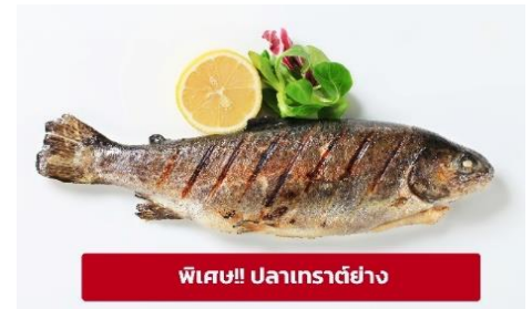
พิเศษ!! ปลาเทราต์ย่าง

นำท่านเดินทางสู่ เมืองมรดกโลกเชสกี ครุมลอฟ (Cesky Krumlov) สาธารณรัฐเช็ก (ระยะทาง 210 กม./ 3.30 ชม.) ล้อมรอบด้วยแม่น้ำ Vltava ทำให้เมืองแห่งนี้มีลักษณะคล้ายหยดน้ำ จนถูกขนานนามว่าเป็น "เมืองหยดน้ำ" จากนั้นนำท่าน ถ่ายรูปบริเวณรอบนอก ปราสาทครุมลอฟ (Cesky Krumlov Castle) เป็นปราสาทกอริคดั้งเดิม ตั้งอยู่ริมฝั่งแม่น้ำวัลตาวอน แหลมหิน มีหอคอยสีชมพูหวานๆ ราวกับปราสาทเจ้าหญิงในนิยาย มีอายุกว่า 700 ปี เคยเป็นคฤหาสน์ส่วนตัวของขุนนางถึง 3 ตระกูล ก่อนจะตกเป็นสมบัติของรัฐบาล