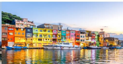
ทำเรือประมงเจิ้งปิ่น