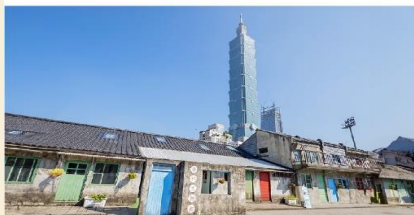
หมู่บ้านชื้อชื้อหนาน