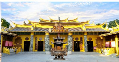
วัดเถาหยวนต้าชี่อึ้งฟู่ช่งจง