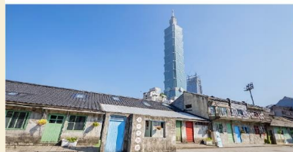
หมู่บ้านชื้อชื้อหนาน