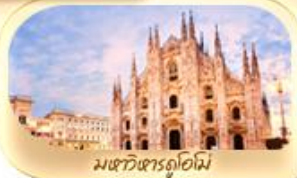
มหาวิหารดูโอโม