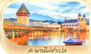
สะพานไมซ์าเปล