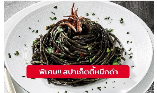
พิเศษ!! สปาเก็ตตีหมึกดำ

Highlight! เมื่อเยือนเกาะเวนิส เมนูที่ขึ้นชื่อและหากได้มาต้องได้ลิ้มลองสปาเก็ตตีผัดซอสหมึกดำที่คลุกเคล้ากับความหอมนุ่มนวลกับบรรยากาศ สุดคลาสสิคฉบับอิตาเลียนต้นตำรับเวนิส