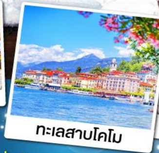
ทะเลสาบโคโม