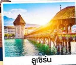
ลูเซิร์น

ณ เมืองลูเซิร์นแบด เมืองแห่งน้ำแร่สวิตเซอร์แลนด์