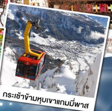
กระเช้าข้ามหุบเขาแกมมีพาส

11-17 มี.ค. 68 02-08 เม.ย. 68 29 เม.ย.-05 พ.ค. 68