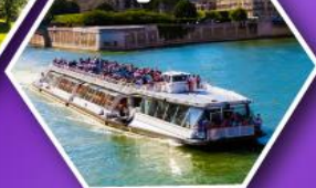
ล่องเรือบาโตมุช ชมกรุงปารีส

เที่ยวเมืองวาอุซ เมืองหลวงของสาธารณรัฐ ลิกเทินสไตน์