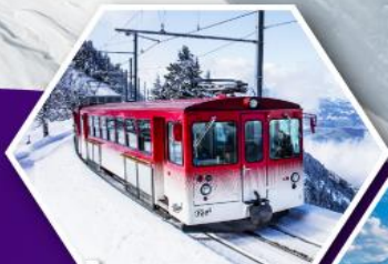
นั่งรถไฟใต้เขาริกิ