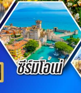
ซีร์มิโอเน่