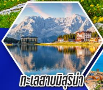
ทะเลสาบมิลูร์น่า