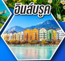
อินส์บรุค

พิชิตอุทยานโคโลโมท์ แบบเต็มอิ่ม พร้อมค้างคืน ที่เมืองโบลซาโนในเขตอุทยาน