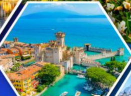
ซีร์มิโอเน่