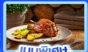
เมนูพิเศษ ขาหมูเยอรมัน