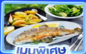
เมนูพิเศษ ปลาเทราต์ย่าง

อัลสส์ตีทท์ เวียนนา อินส์บรุค ปราสาทนอยชวานสไตน์ ลูเซิร์น ริก