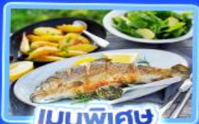
เมนูพิเศษ ปลาเทราต์ย่าง

อัลสส์ตีทท์ เวียนนา อินส์บรุค ปราสาทนอยชวานสไตน์ ลูเซิร์น ริก