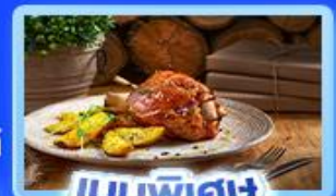
เมนูพิเศษ ขาหมูเยอรมัน