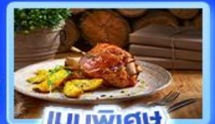
เมนูพิเศษ ขาหมูเยอรมัน