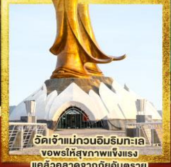
วัดเจ้าแม่กวนอิมริมทะเล ขอพรให้สุขภาพแข็งแรง แคล้วคลาดจากภัยอันตราย