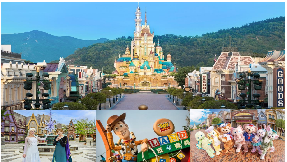
Option: Disneyland (ไม่รวมค่าเดินทาง)