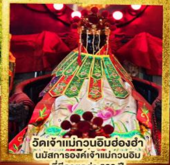
วัดเจ้าแม่กวนอิมฮ่องกง นมัสการองค์เจ้าแม่กวนอิม ที่มีอายุกว่า 600 ปี

★★★★ พัก 4 ดาวทุกคืน ย่านช้อปปิ้งจิมซาจุ่ย