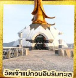
วัดเจ้าแม่กวนอิมริมทะเล