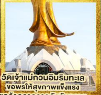
วัดเจ้าแม่กวนอิมริมทะเล ขอพรให้สุขภาพแข็งแรง แคล้วคลาดจากภัยอันตราย