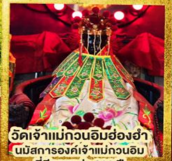
วัดเจ้าแม่กวนอิมฮ่องกง นมัสการองค์เจ้าแม่กวนอิม ที่มีอายุกว่า 600 ปี

★★★★ พิก 4 ดาวทุกคืน ย่านช้อปปิ้งจิมซาจуй