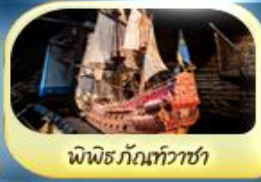
พิพิธภัณฑ์ท้าวชา