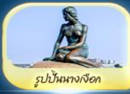
รูปปั้นนางเงือก