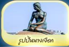
รูปปั้นนางเงือก