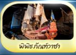
พิพิธภัณฑ์ท้าวชา