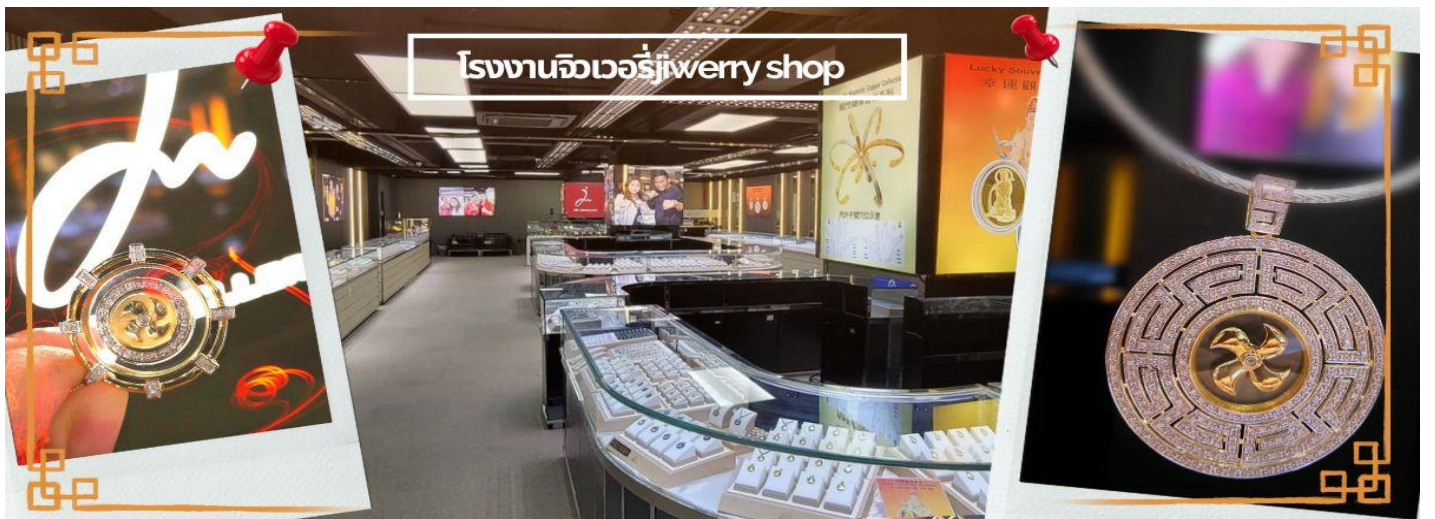
โรงงานจิวเวอรี่jewelry shop

จากนั้นนำท่านชม โรงงานจิวเวอรี่ ซึ่งเป็นโรงงานที่มีชื่อเสียงที่สุดของฮ่องกงในเรื่องการออกแบบเครื่องประดับ อาทิเช่น จี้ และแหวนกำหั้น ที่สวยงามโดดเด่นไม่เหมือนใคร ซึ่งถือกำเนิดขึ้นที่นี่และมีชื่อเสียงที่สุดใช้ไปเครื่องประดับติดตัว และเสริมดวงชะตา สินค้าทุกชิ้นมีเอกสารรับประกันคุณภาพเปลี่ยน ซ่อม ได้ตลอดอายุการใช้งาน หากเกิดการชำรุดจากสินค้าไม่ใช่อุบัติเหตุ