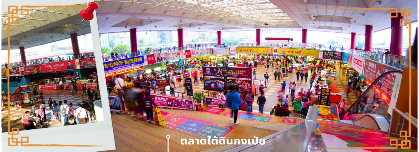
ตลาดไต้ดินกงเป่ย

จากนั้นนำท่าน อิสระช้อปปิ้งตลาดไต้ดินกงเป่ย ตั้งอยู่ติดชายแดนมาเก๊า เป็นศูนย์การค้าดีดแอร์ ที่มีร้านค้ามากกว่า 5,000 ร้านค้า มีสินค้าให้ท่านเลือกมากมาย เช่น สินค้าก๊อปปี้แบรนด์เนมต่างๆ ไม่ว่าจะเป็นเสื้อผ้า รองเท้า กระเป๋า นาฬิกา ของเด็กเล่น ฯลฯ ที่นี่ มีสินค้าให้เลือกซื้อหลากหลาย จึงเป็นที่นิยมมากของชาวมาเก๊า และฮ่องกง เนื่องจากสินค้าที่นี่มีคุณภาพและราคาถูก