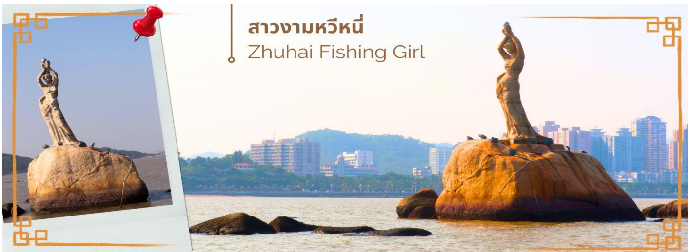
สาวงามหวีหนี่ Zhuhai Fishing Girl

CHBHS ชั่งกง-มาเก๊า-จูไห่ 4 วัน 2 คืน บิน Greater Bay Airlines (HB)