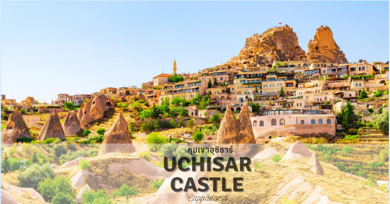
หุบเขาอุชิซาร์ UCHISAR CASTLE Cappadocia

แวะถ่ายรูป หุบเขานกพิราบ (PIGEON VALLEY) จุดชมวิวยู่ตรงบริเวณหน้าผาที่ชาวเมืองโบราณได้ขุดเจาะเป็นรู เพื่อให้นกพิราบเข้าไปทำรังอาศัยอยู่ ชาวบ้านเลี้ยงนกพิราบไว้เพื่อนำมูลมาทำเป็นปุ๋ยบำรุงต้นไม้ จากจุดชมวิวสามารถมองเห็นปราสาทอุชิซาร์ (UCHISAR CASTLE) และยังมีต้นไม้จำลองที่เต็มไปด้วยดวงตาสีฟ้าแขวนอยู่โดดเด่น อิสระถ่ายภาพตามอัธยาศัย