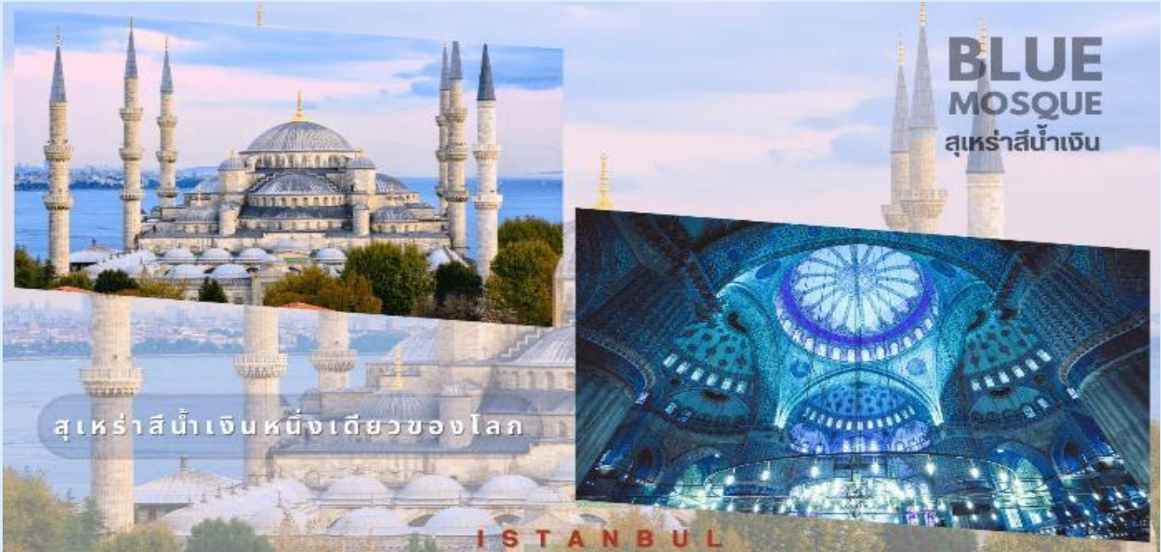
สุเหร่าสีน้ำเงินหนึ่งเดียวของโลก

นำท่านชม จัตุรัสสุลต่านอะห์เมต หรือ ฮิปโปโดรม (HIPPODROME) (ภายนอก) สนามแข่งม้าของชาวโรมัน จุดศูนย์กลางแห่งการท่องเที่ยวเมืองเก่า สร้างขึ้นในสมัยจักรพรรดิเซปติมิอุสเซเวอรัสเพื่อใช้เป็นที่แสดงกิจกรรมต่างๆ ของชาวเมือง ต่อมาในสมัยของจักรพรรดิคอนสแตนติน ฮิปโปโดรมได้รับการขยายให้กว้างขึ้นตรงกลางเป็นที่ตั้งแสดงประติมากรรมต่างๆซึ่งส่วนใหญ่เป็นศิลปะในยุคกรีกโบราณในสมัยออตโตมันสถานที่แห่งนี้ใช้เป็นที่จัดงานพิธีแต่ในปัจจุบันเหลือเพียงพื้นที่ลานด้านหน้ามัสยิดสุลต่านอะห์เมตซึ่งเป็นที่ตั้งของเสาโอเบลิสก์ 3 ต้น คือเสาที่สร้างในอียิปต์เพื่อถวายแก่ฟาโรห์ทุตโมซิสที่ 3 ถูกลากกลับมาไว้ที่อิสตันบูลเสาต้นที่สอง คือ เสาสูง และเสาต้นที่สาม คือ เสาคอนสแตนตินที่ 7