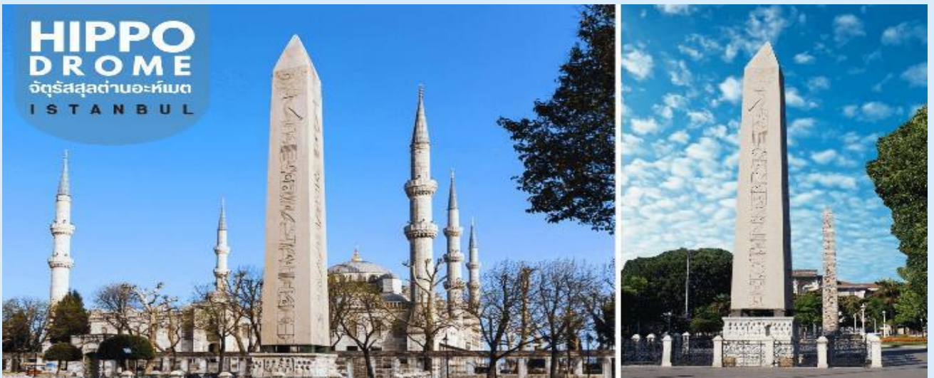
HIPPO DROME จัตุรัสสุลต่านอะห์เมต ISTANBUL

นำท่านชม จัตุรัสสุลต่านอะห์เมต หรือ ฮิปโปโดรม (HIPPODROME) (ภายนอก) สนามแข่งม้าของชาวโรมัน จุดศูนย์กลางแห่งการท่องเที่ยวเมืองเก่า สร้างขึ้นในสมัยจักรพรรดิเซปติมิอุสเซเวอรัสเพื่อใช้เป็นที่แสดงกิจกรรมต่างๆ ของชาวเมือง ต่อมาในสมัยของจักรพรรดิคอนสแตนติน ฮิปโปโดรมได้รับการขยายให้กว้างขึ้นตรงกลางเป็นที่ตั้งแสดงประติมากรรมต่างๆซึ่งส่วนใหญ่เป็นศิลปะในยุคกรีกโบราณในสมัยออตโตมันสถานที่แห่งนี้ใช้เป็นที่จัดงานพิธีแต่ในปัจจุบันเหลือเพียงพื้นที่ลานด้านหน้ามัสยิดสุลต่านอะห์เมตซึ่งเป็นที่ตั้งของเสาโอเบลิสก์ 3 ต้น คือเสาที่สร้างในอียิปต์เพื่อถวายแก่ฟาโรห์ทุตโมซิสที่ 3 ถูกลากกลับมาไว้ที่อิสตันบูลเสาต้นที่สอง คือ เสาสูง และเสาต้นที่สาม คือ เสาคอนสแตนตินที่ 7