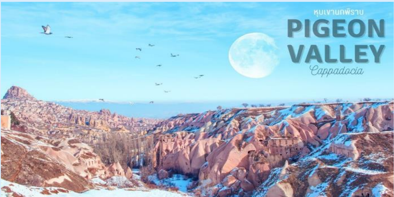
หุบเขานกพิราบ PIGEON VALLEY Cappadocia

แวะถ่ายรูป หุบเขานกพิราบ (PIGEON VALLEY) จุดชมวิวยู่ตรงบริเวณหน้าผาที่ชาวเมืองโบราณได้ขุดเจาะเป็นรู เพื่อให้นกพิราบเข้าไปทำรังอาศัยอยู่ ชาวบ้านเลี้ยงนกพิราบไว้เพื่อนำมูลมาทำเป็นปุ๋ยบำรุงต้นไม้ จากจุดชมวิวสามารถมองเห็นปราสาทอุชิซาร์ (UCHISAR CASTLE) และยังมีต้นไม้จำลองที่เต็มไปด้วยดวงตาสีฟ้าแขวนอยู่โดดเด่น อิสระถ่ายภาพตามอัธยาศัย