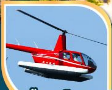
ขึ้นเฮลิคอปเตอร์ ชมวิว 360 องศา