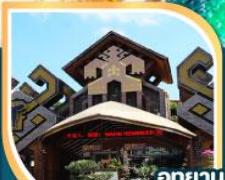
อุทยานวัฒนธรรมฝ่าฝ้าแม่่ว-หลี่ กิจกรรมรอบกองไฟ