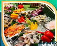
บุฟเฟ่ต์ รวมเครื่องคัม แอลกอฮอล์แบบไม่อั้น

01-05, 08-12 ม.ค.68 15-19, 22-26 ม.ค.68 12-16, 19-23 ก.พ.68 26 ก.พ.-02 มี.ค.68 05-09, 12-16, 19-23 มี.ค.68