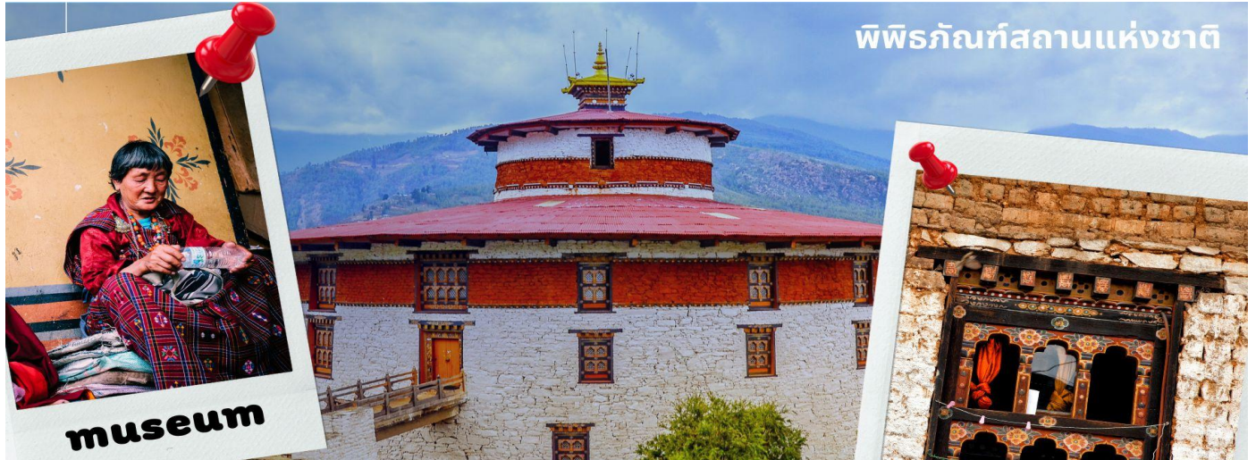
พิพิธภัณฑสถานแห่งชาติ

รับประทานอาหารเที่ยง ณ ภัตตาคาร (มื้อที่ 1)