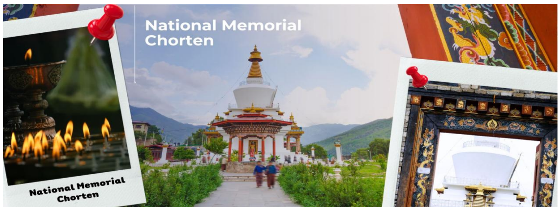
National Memorial Chorten

เช้า รับประทานอาหารเช้า ณ โรงแรมที่พัก (มื้อที่ 3) นำท่านชม National Memorial Chorten อนุสรณ์มหาสถานแด่กษัตริย์รัชกาลที่ 3 แห่งประเทศภูฏานสร้างในปี ค.ศ. 1974 มีผู้คนมากมายเดินทางมาแสวงบุญและสวดมนต์ประกอบพิธีกรรมทางศาสนาต่างๆ