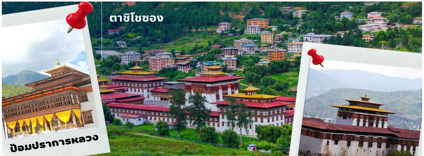
ตาสิโซของ

นำท่านเดินทางสู่ เมืองทิมพู เมืองหลวงของประเทศภูฏานตั้งแต่ปี ค.ศ. 1961 ใช้เวลาการเดินทางประมาณ 1 ชม. นำท่านเดินทางเข้าชม ตาสิโซของ มหาปรการแห่งศาสนาและวิหารหลวงแห่งเมืองทิมพู (วันธรรมดาเปิดหลัง 16.30น. / เสาร์-อาทิตย์ เปิดทั้งวัน) ตาสิโซของ หมายถึง ป้อมแห่งศาสนาอันเป็นมงคล สร้างในสมัยศตวรรษที่ 12 โดย ท่านซังดรุง งาวัง นัมเกล ปัจจุบันเป็นสถานที่ทำงานของพระมหากษัตริย์ สถานที่ทำการของกระทรวงต่างๆ และวัด รวมทั้งเป็นพระราชวังฤดูร้อนของพระสังฆราช และบริเวณอันใกล้ท่านจะได้เห็นวังที่ประทับส่วนพระองค์ของพระราชอาธิบดีจิกมีด้วย