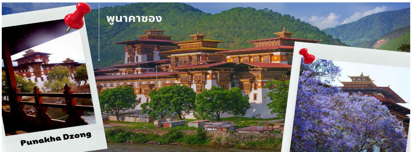
ภูนาคซอง

CB3PBH1 ภูฏาน 5 วัน 4 คืน ภูฏาน แอร์ไลน์ B3 (Nov-Apr 25)