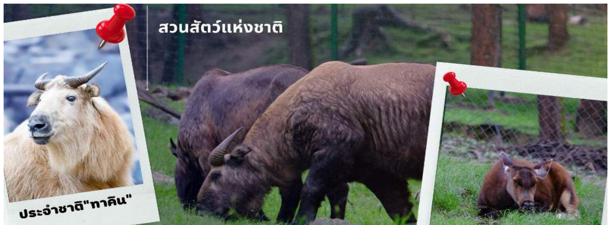
สวนสัตว์แห่งชาติ

นำท่านชม สวนสัตว์แห่งชาติของประเทศภูฏาน และชมสัตว์ประจำชาติ ทาคิน ที่มีรูปร่างลักษณะพิเศษผสมระหว่างแพะกับวัว มีแห่งเดียวในประเทศภูฏานเท่านั้น ซึ่งครั้งหนึ่งประเทศสหรัฐอเมริกาเคยเจรจาของไปเลี้ยงแต่ได้รับการปฏิเสธจากรัฐบาลประเทศภูฏาน ทาคิน เป็นสัตว์ในตำนานประวัติศาสตร์ของศาสนาพุทธ โดยเชื่อว่าท่านลามะ Drukpa Kunley เป็นผู้สร้างขึ้นจากกระดูกของแพะและวัวที่ท่านได้ทานเป็นอาหาร กอกระดูกก็กลับมามีชีวิตอีกครั้งกลายเป็น ตัวทาคิน ที่มีลักษณะคล้ายกับแพะและวัวผสมกัน