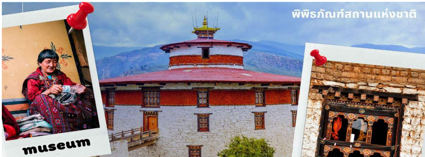
พิพิธภัณฑ์สถานแห่งชาติ

รับประทานอาหารเที่ยง ณ ภัตตาคาร (มื้อที่ 1)