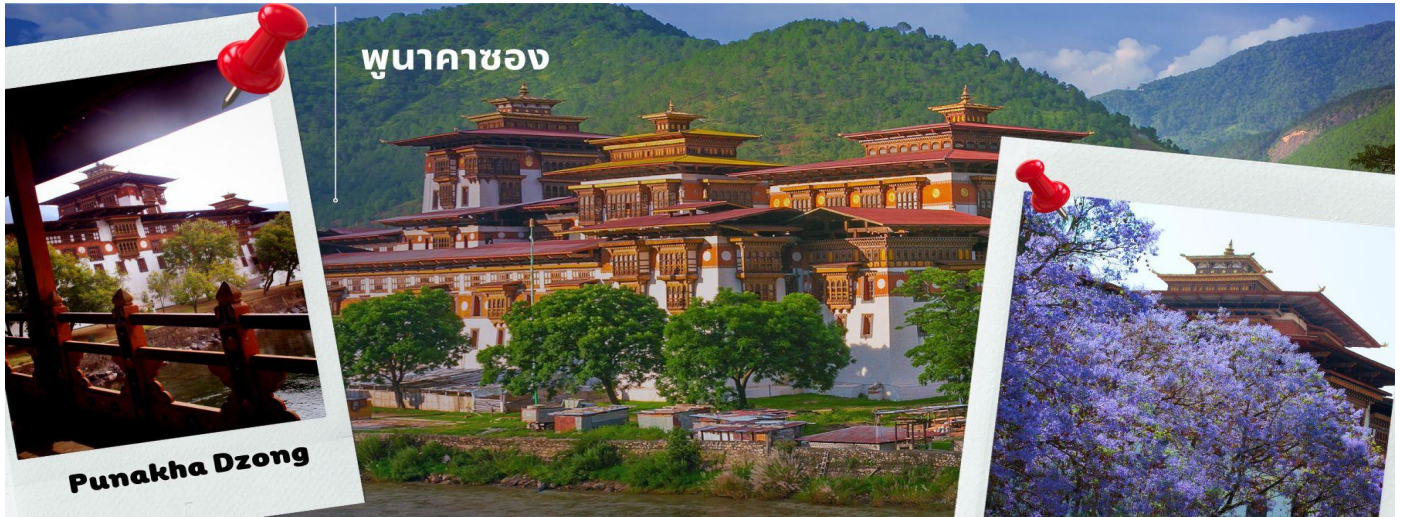
พุนาคาซอง

CB3PBH1 ภูฏาน 5 วัน 4 คืน ภูฏาน แอร์ไลน์ B3 (Nov-Apr 25)