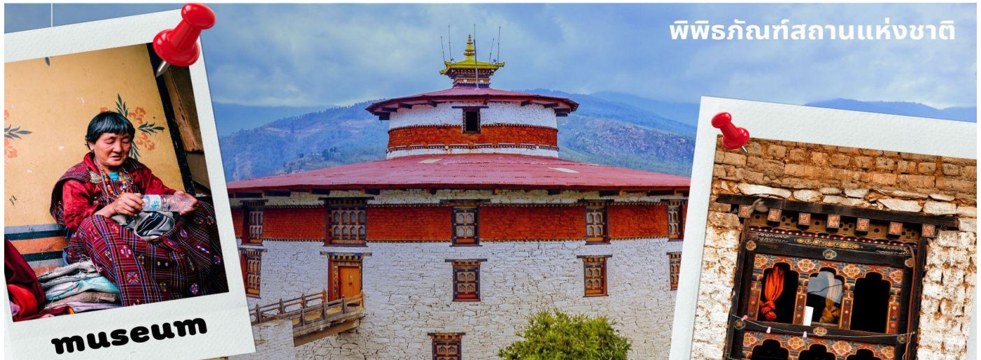
พิพิธภัณฑสถานแห่งชาติ

รับประทานอาหารเที่ยง ณ ภัตตาคาร (มื้อที่ 1)