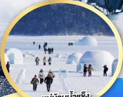
หมู่บ้านน้ำแข็ง แห่งทะเลสาบชิคาริเบ็ตสึ