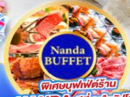
Nanda BUFFET พิเศษบุฟเฟ่ต์ร้าน NANDA ดีที่สุดในซัปโปโร