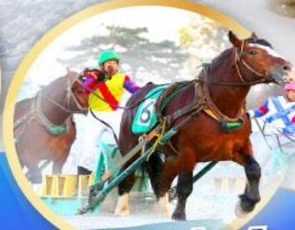
สนามม้าบับอะโทคาจิ