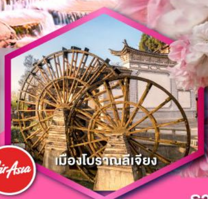
เมืองโบราณลีเจียง