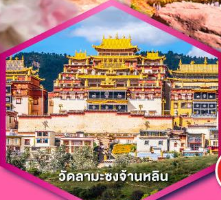
วัดลามะ-ชงจ้านหลิบ