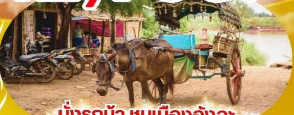
นั่งรถม้า ชมเมืองอังวะ

🍽️ อาหาร 6 มื้อ 🚰 น้ำดื่ม 30 KG 🛏️ ระดับ 4 ดาว 📄 รวมประกันการเดินทาง ✈️ สนามบินดอนเมือง