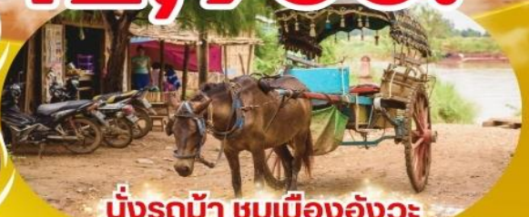
นั่งรถม้า ชมเมืองอังวะ

🍽️ อาหาร 6 มื้อ 🚰 น้ำดื่ม 30 KG 🛏️ ระดับ 4 ดาว 📄 รวมประกันการเดินทาง ✈️ สนามบินดอนเมือง