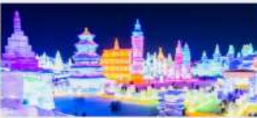
เทศกาลโคน้ำแข็ง