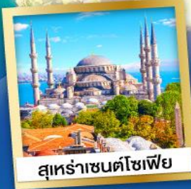
สุเหร่าซนต์โซเฟีย