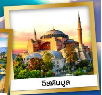
อิสตันบูล