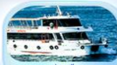
ล่องเรือ ช่องแคบบอสฟอรัส