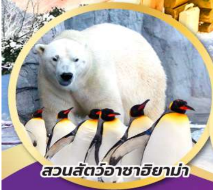
สวนสัตว์อาซาฮยาม่า