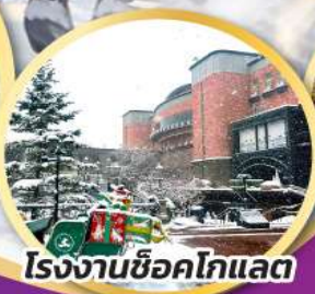
โรงงานช็อคโกแลต