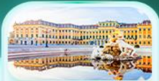
พระราชวังซินบรุนน์