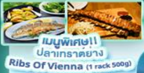
เมนูพิเศษ!! ปลาเทราต์ย่าง Ribs Of Vienna (1 rack 500g)