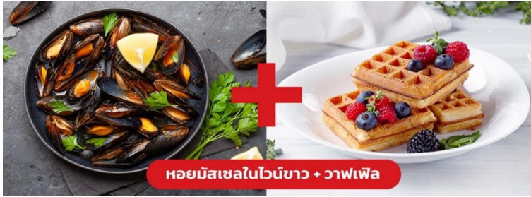
หอยมัสเซลในไวน์ขาว + วาฟเฟิล

เย็น ๑๐ รับประทานอาหารเย็น (มื้อที่10) เมนูพิเศษ!! หอยมัสเซล + วาฟเฟิล (Mussel in White wine + Waffle)