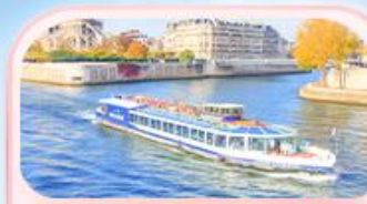
คลองเรือแม่น้ำแซน