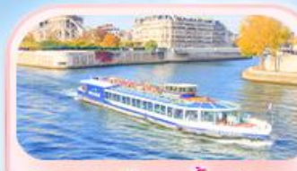
คลองเรือแม่น้ำแซน