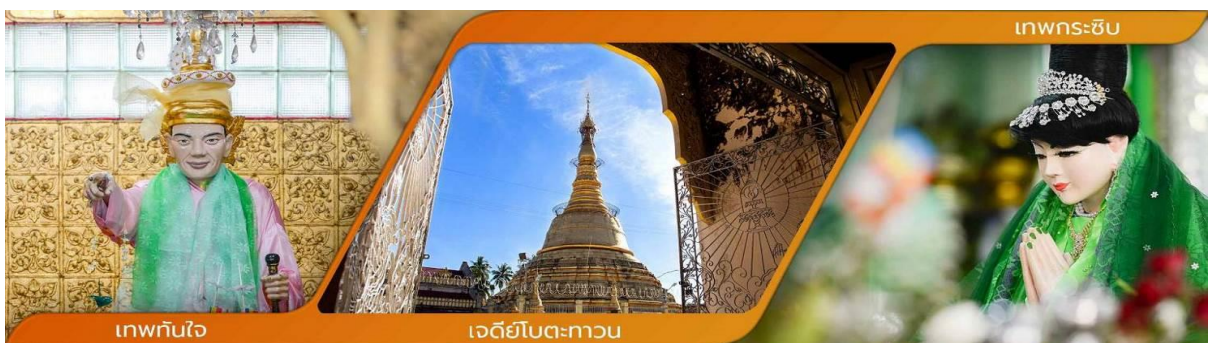
เทพทันใจ

วิธีการสักการะรูปปั้นเทพทันใจ (นัตโบโบยี) เพื่อขอสิ่งใดแล้วสมตามความปรารถนาก็ให้เอาดอกไม้ ผลไม้ โดยเฉพาะมะพร้าวอ่อน กล้วย จากนั้นก็ให้เอาเงินจะเป็นดอลลาร์ บาท หรือจ๊าด ก็ได้ แล้วเอาไปใส่มือของนัตโบโบยี 2 ใบ ไหว้ขอพรแล้วดิกกลับมา 1 ใบ เอามาเก็บรักษาไว้ จากนั้นก็เอาหน้าผากไปแตะกับนิ้วชี้ของนัตโบโบยี แค่นี้ท่านก็จะสมตามความปรารถนาที่ตั้งใจไว้ คำบูชาเทพทันใจ เอหิ สักกะ มหานัทโปะโปะจีโปตะถ่องสิทธิมัดดู อิทังพะลัง เอตัสสะมิงรัตตะนัง พุทธัง ธัมมัง สังฆัง เทวานัง ประสิทธิลาภ ชโยนิจจัง วันทามิสัพพะทา สวาโหม